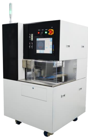
图片：单轴半自动 8-12 吋划片机